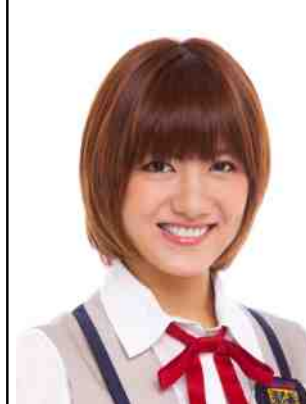
宮澤佐江(SNH48・アイドル)日本に留まらず、リーダーシップを発揮して、SNH48のメンバーとして活躍中