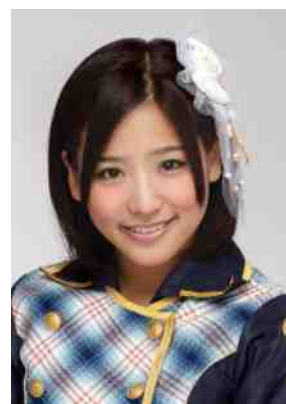
仲川遙香(JKT48・アイドル) JKT48の移籍を機に、インドネシア語にチャレンジ。流暢な会話でファンを魅了。