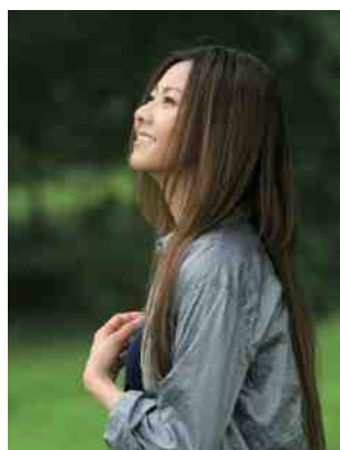
倉木麻衣(シンガー) 16歳で全米デビュー。イギリスに2回、アメリカに1回の短期留学歴がある。