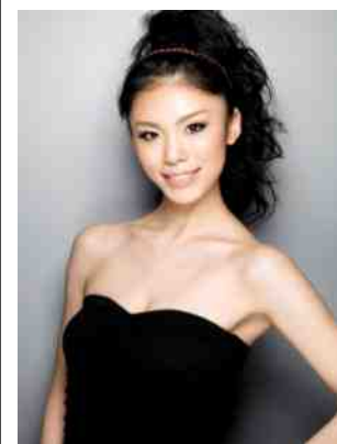
森理世(ミスユニバース2007)高校からカナダへ留学。教職課程を修了して帰国。