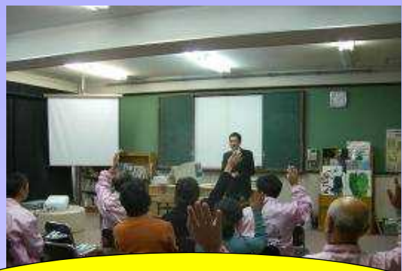
警察との連携・サイバー犯罪防止講習