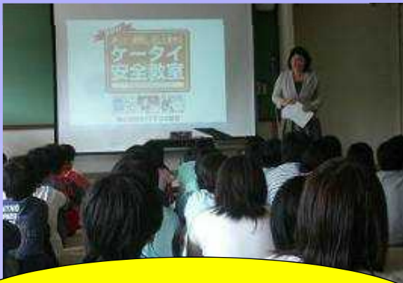
企業との連携・携帯安全教室