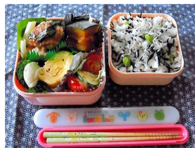
食育推進コンテスト（教育委員会賞）受賞作品

行政・企業・関係機関と連携して、市内在住の小中高特別支援学校生（公私立含む）、PTA会員を対象としてお弁当による「食育推進コンテスト」を開催。