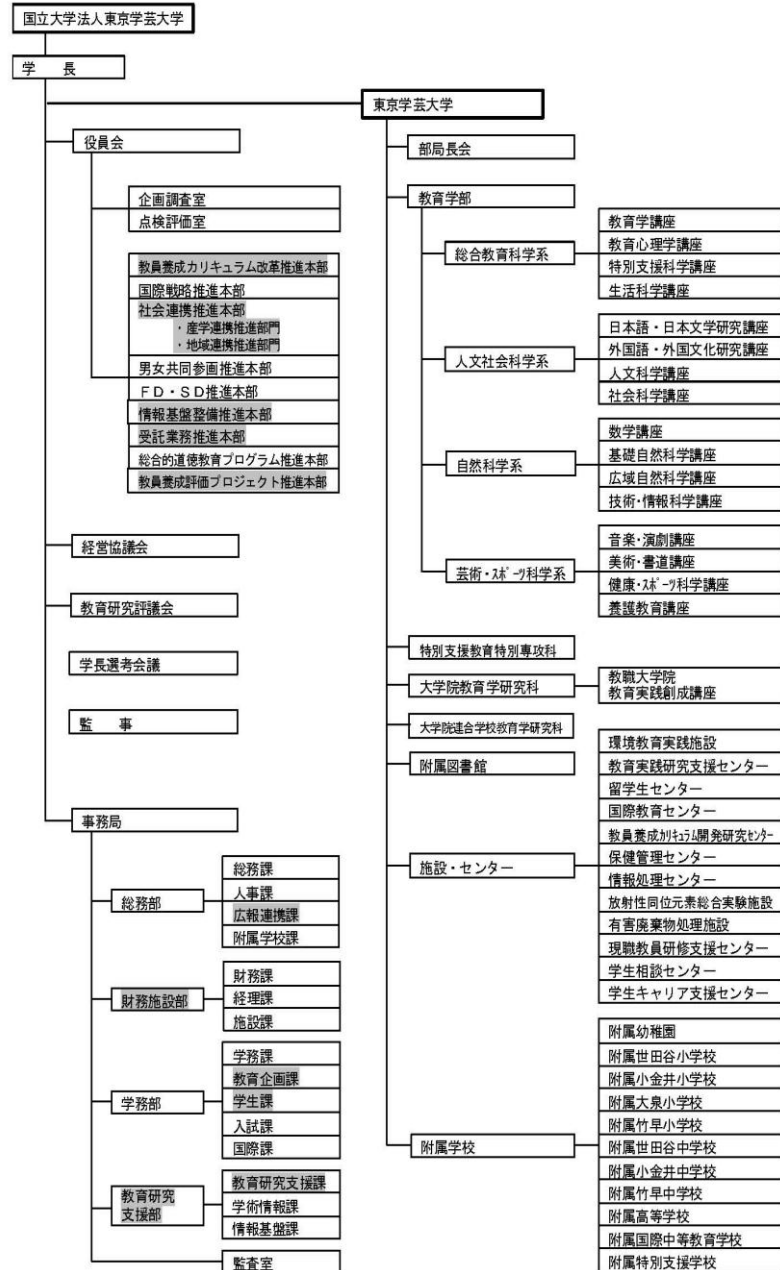
機構図（平成22年4月1日現在）