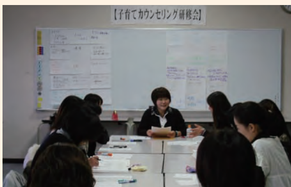
子育てカウンセリング・親の会

子育ての根っこが幼児教育にあると言われ、幼児期の家庭教育が重要であることから、幼児がいる家庭を中心に「家庭教育支援サポーター」等による訪問活動の他、保護者の学習機会を提供する必要がある。