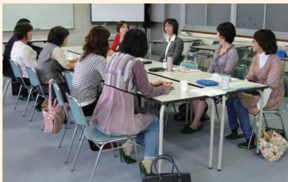
サポーターサポート会議

「家庭教育支援チーム」による支援のなかには、兄弟姉妹が多校種にまたがるケースも多くみられる。このようなケースでは、サポーターどうしの会議(サポーターサポート会議)や関係機関を含めたケース会議により、連携が強化され、支援の効果が校種をまたいで波及したケースもあり、校種間、関係諸機関の支援連携もモデルとなるような成果がみられている