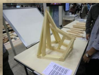
伝承技能・技能五輪見学