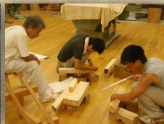
教員の高度技術数得