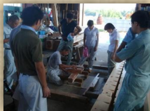
企業技術者による学校での指導