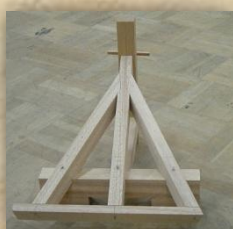
技能検定にチャレンジ