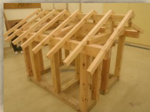
指導資料・教材作成(ビデオ・模型)