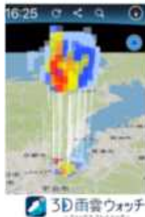
ゲリラ豪雨対策支援システム管理画面 (神戸市と実証実験中)