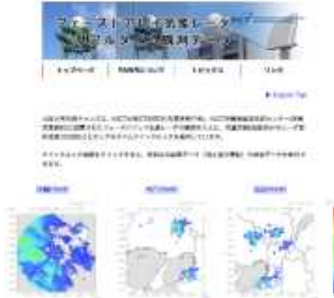
NICTの外部向けWebサイト