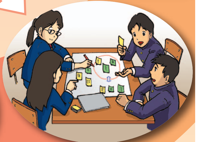
付箋を使って話し合う

生徒一人一人が自分の考えをもち、他者の考えとの共通点や相違点を意識しながら考えを深めていくような言語活動を充実しましょう。