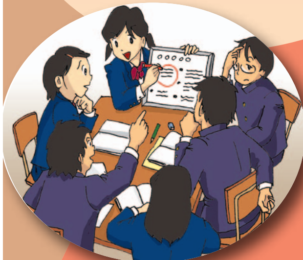
ホワイトボードを使って話し合う