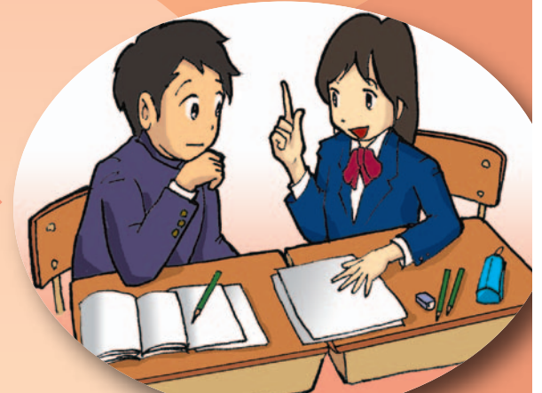
ペアで意見を交換する