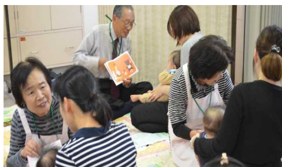
プレゼンターによる読み聞かせの説明

「四ヶ月健診の祭、直接本を渡された時、とてもうれしく、温かさを感じていました。まだ四ヶ月の赤ちゃんですが、1ページずつ広げて見せていただいた時には、とても興味深げにじっと見ていました。私も感動しました。」とあるお母さんの感想でした。