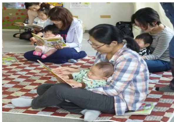
《母親によるファーストブックの読み聞かせ》

「はじめて参加しましたが、手遊びでは子どもが笑って楽しそうでした。また、抱っこして絵本を読んであげると指さしをするので、この子わかっているのかなと思いました。」と嬉しそうに話しました。