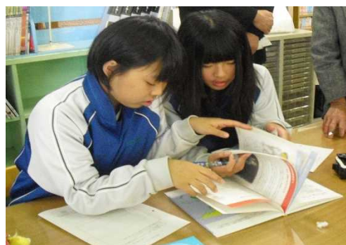
《図書館の本を使って調査するAさん》

Aさんは、栄養不足の問題が世界規模の問題であることを再確認し、その解決のために様々な活動が行われていることを図書館の資料から知り、日本から世界へと考えを広めることができました。