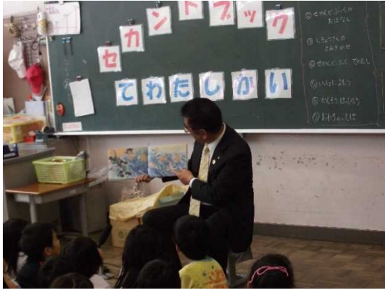
《市長による読み聞かせ》