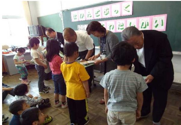
《行政、地域役員、ボランティアによる手渡し》