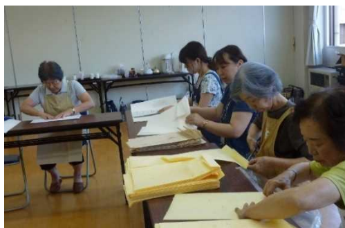
《和紙を使って袋作り》

茅野市では2000年（H12）に、全国に先がけて赤ちゃんに絵本を贈る「ファーストブックプレゼント」が公民協働による「読書の森 読り一むin ちの」が主体にはじめられ、現在では18,800冊プレゼントされています。茅野市では年間500人ほどの赤ちゃんが誕生しますから、赤ちゃん1人に対して二冊分の本代に活動費等を含めて毎年200万円が予算化されます。「読り一むin ちの」が中心になり「ファーストブック30冊」のリストを作りその中から、保護者が本を選び、一冊目は出生届を出しに来た市民課の窓口で渡し、二冊目は健康管理センターの四ヶ月健診の時に渡します。四ヶ月健診では、スタッフがまず読んで聞かせ、その後家の人に読んでもらいます。