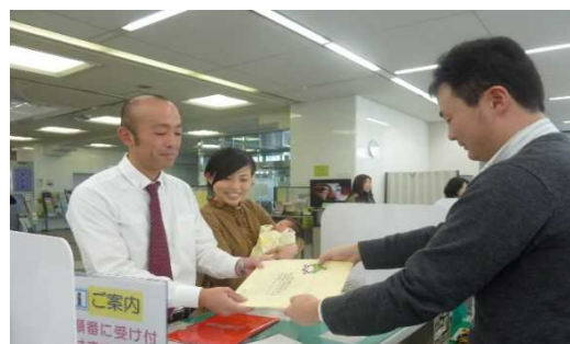
《出生届時に市民課窓口からのプレゼント》