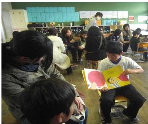
《お母さん聞いてよ》

保護者・家族や地域の方々が読書参観を参観することによって、こどもの学習活動の様子を観察し、茅野市が「読書」を大切にしていることを理解すると共に、家庭や地域での読書のあり方を考える場とする。(家庭読書、読書ボランティアへの参加等)