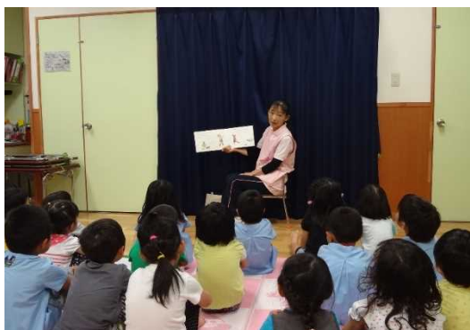
《朝のおはなしのへや》