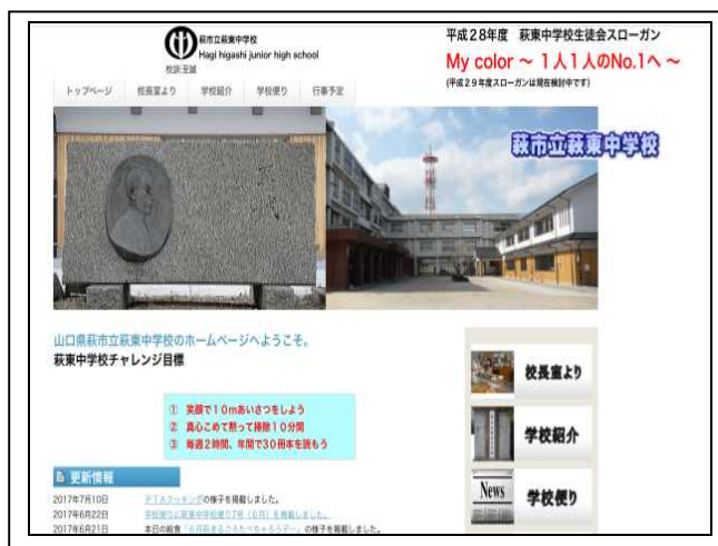
【ホームページへの掲載で周知】

毎年、いじめ防止基本方針を見直し、学校で説明するとともに、ホームページへ掲載し、広く周知している。