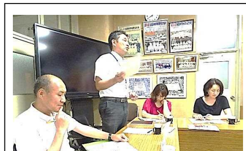
【学校運営協議会で情報を開く】

いじめ事案を含め、本校で生徒指導上問題になっていることを、学校運営協議会で毎回情報共有するとともに、地域から意見をいただくなど必要な支援について協議を行っている。 このように、 情報を開き、地域・家庭との連携強化に努めること で、「 地域の子どもは地域で育てる 」当事者意識を高めたいと考えている