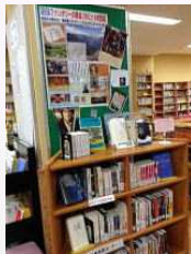
新着図書コーナー