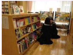
多巻検索で本を選ぶ生徒