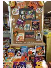
多読・季節の展示