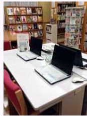
パソコンコーナー