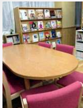
ブラウジングコーナー