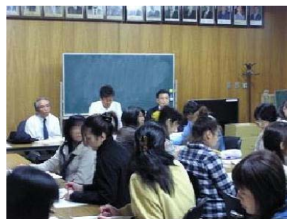
「共育を語ろう会」の様子

また、同校では、毎月1回「共育を語ろう会」と称し、保護者、地域住民の誰が来てもよい意見交換会を開いている。堅苦しい場でなく、井戸端会議的なものを目指しており、校長がその時々に応じて、学力、いじめ、学校の安全、進路などの話題を提供して、対話している。個人情報に留意したうえで、校長にとっては公式な場では言いにくいことも意見交換できる場となっている。