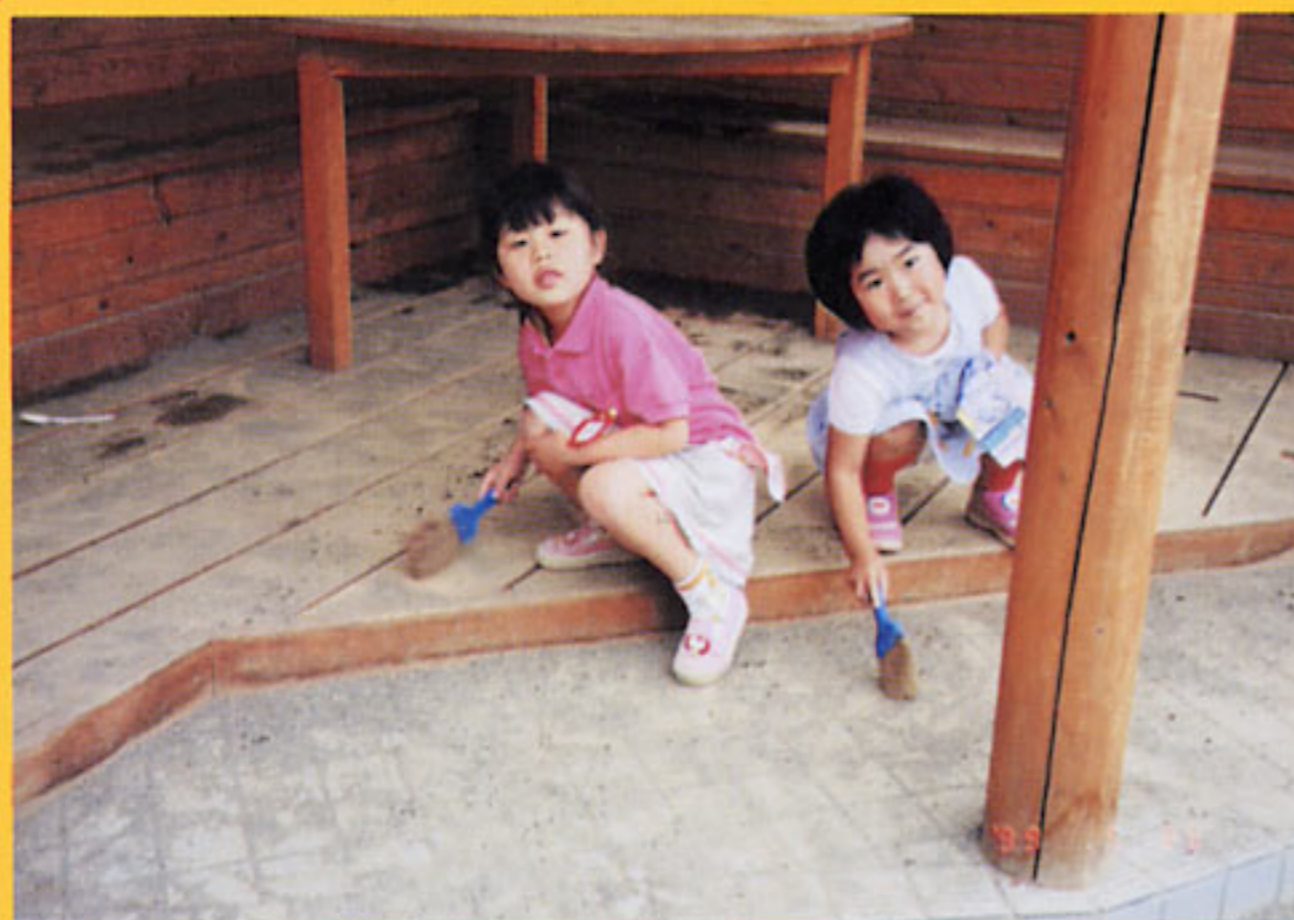
幼児たちの憩いの基地 送迎の親たちのおしゃべりの場にもなっている (栃木県:めぐみ幼稚園)