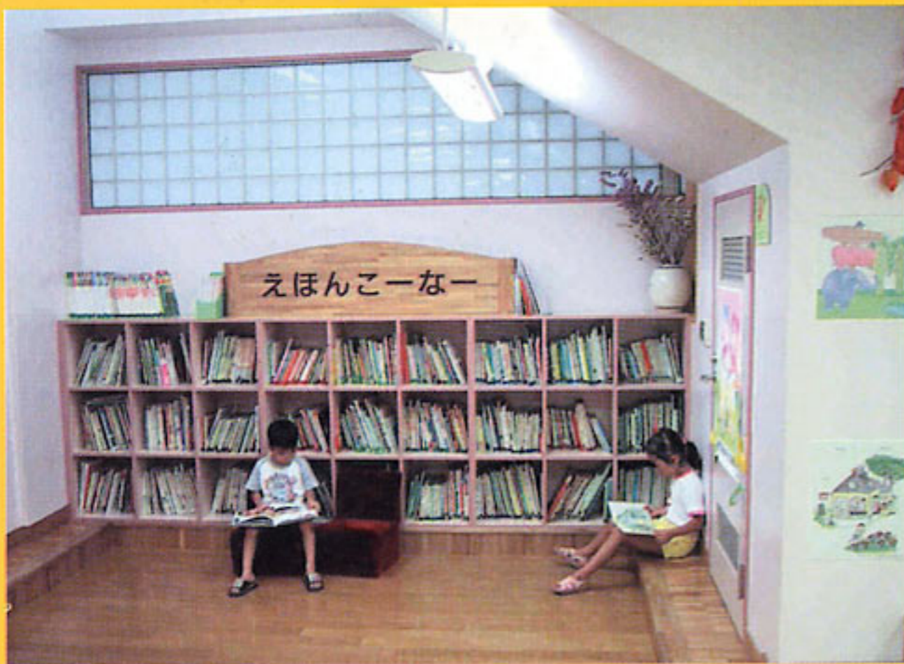
くつろぎ、楽しむことのできる図書スペース (東京都:台東区立石浜幼稚園)