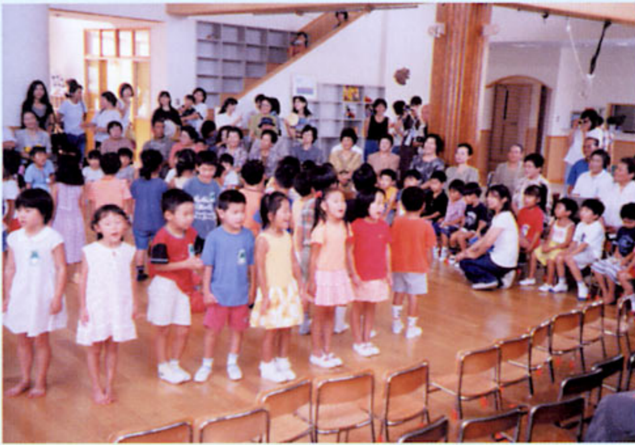
家庭や地域の人々との交流スペース おじいちゃん おばあちゃんも一緒に (栃木県:めぐみ幼稚園)