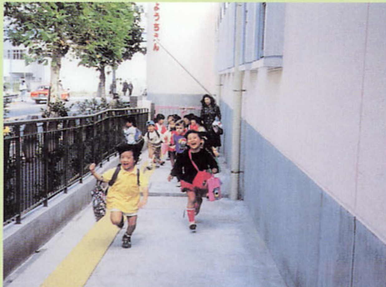
利用者にとって支障のない出入口のスロープ (東京都:港区立中之町幼稚園)