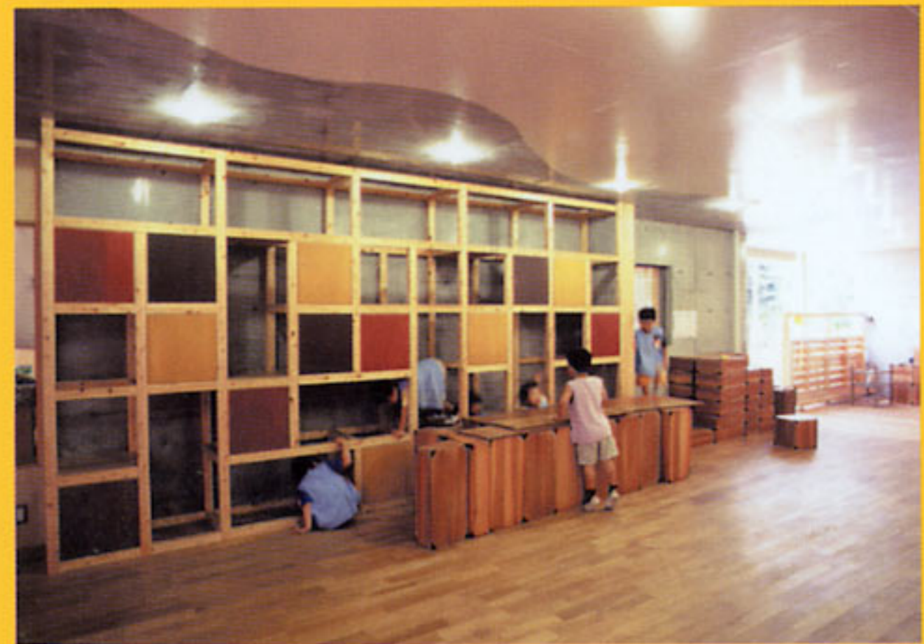
収納空間や多様なコーナーを設け、幼児の遊びを 生み出す場として壁面を活用 (東京都:白金幼稚園)