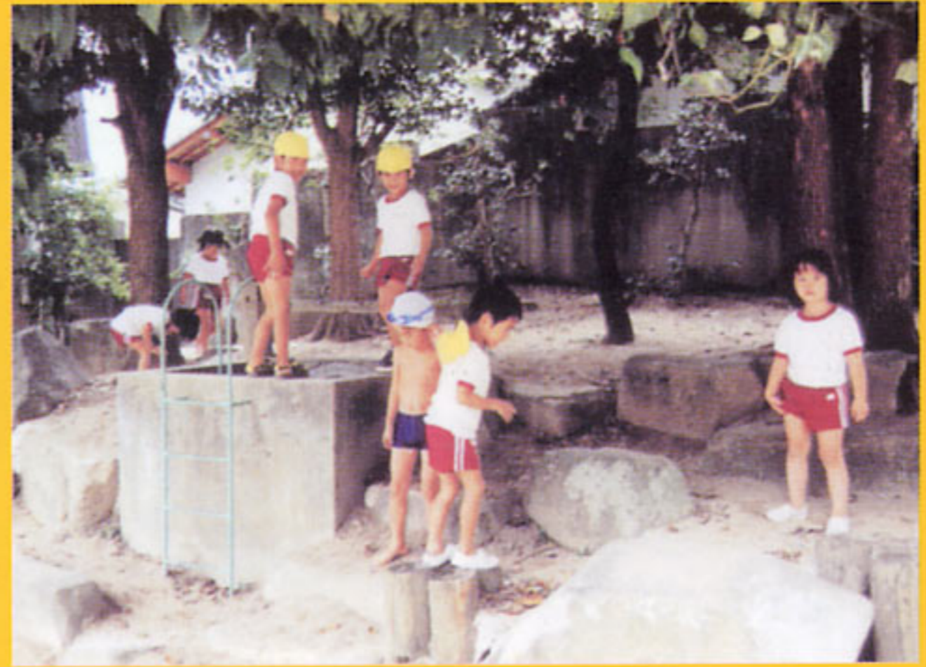
幼児の豊かな創造性を発揮できる自然地形を 有効利用したスペース (広島県:三次中央幼稚園)