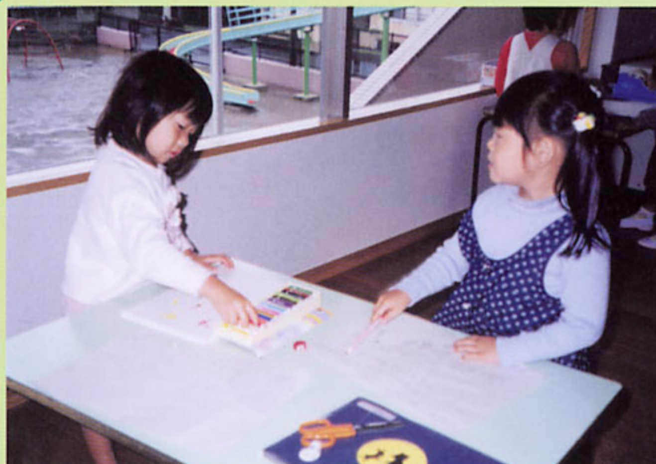
幼児の目線により外部の様子がわかる高さの腰壁 (栃木県:めぐみ幼稚園)