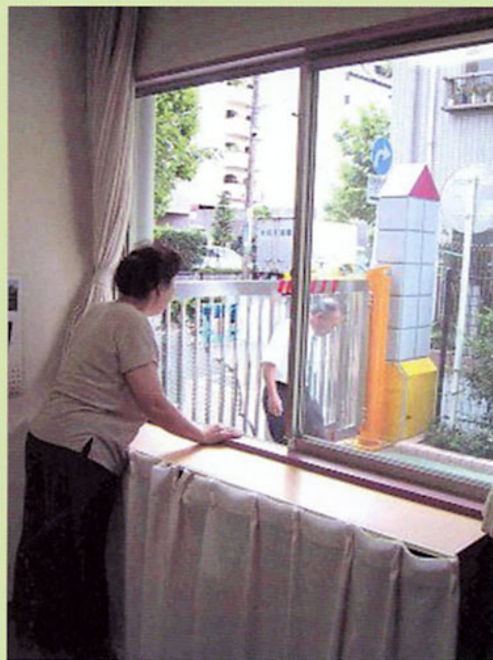
出入口において来訪者を確認できるようにするため見通しを確保 (東京都:台東区立石浜幼稚園)