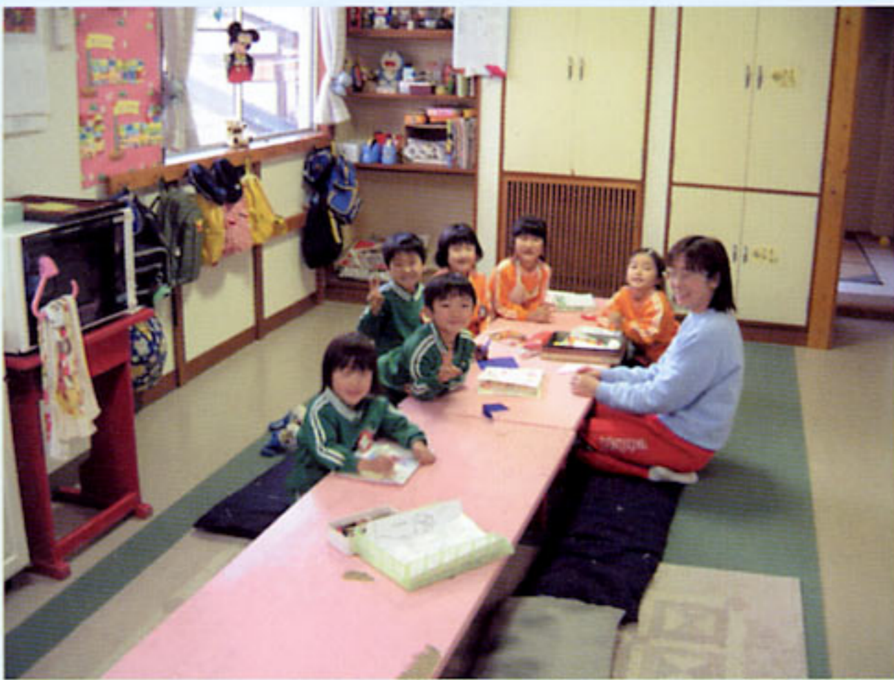
幼児に負担のないよう配慮した、昼寝、おやつ、自由遊び のできる預かり保育室 (茨城県:ふたば文化幼稚園)