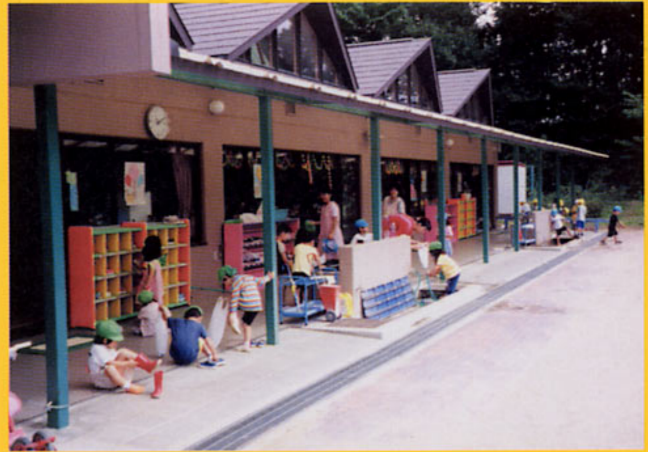
自然の中で伸び伸びと遊べるよう、園舎部分と屋外 空間との連続性に配慮した半屋外空間 (福島県:三春町立岩江幼稚園)