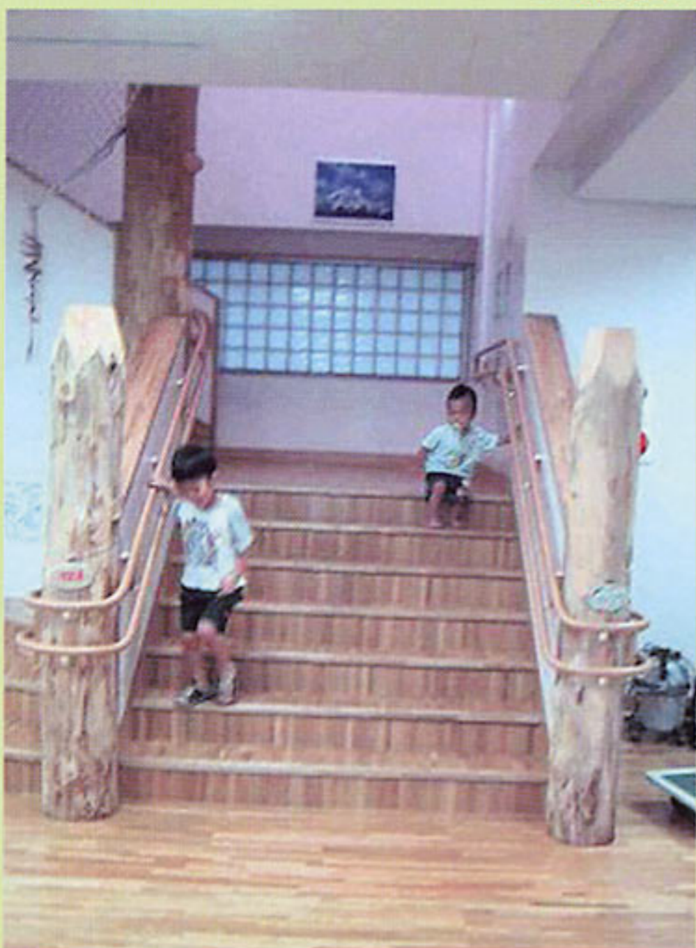
幼児の成長に配慮したユニバーサルデザインによる階段の手すり (東京都:台東区立石浜幼稚園)