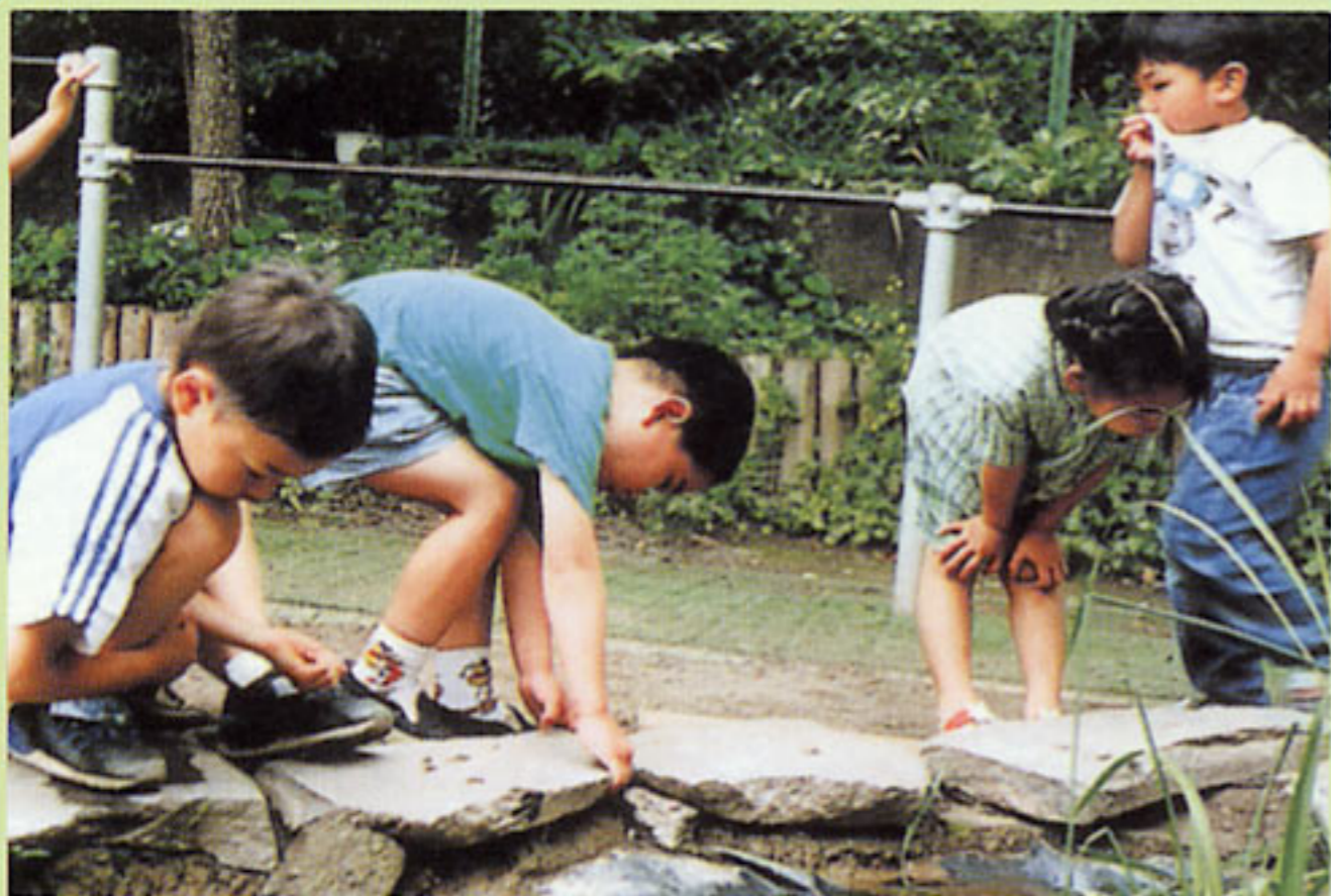
生き物の成長や変化を観察できるビオトープ (東京都:港区立中之町幼稚園)