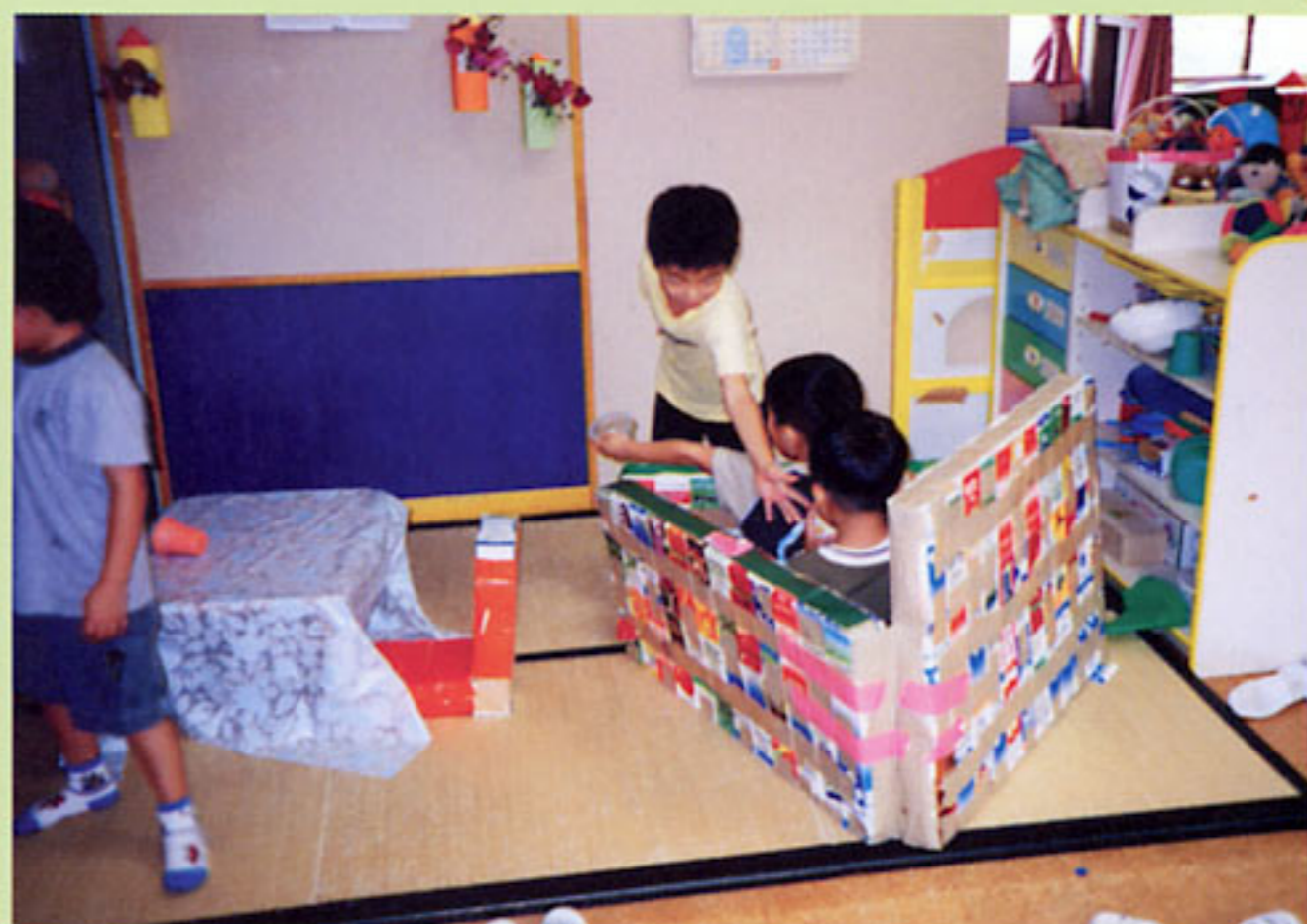
幼児の心を和ませ、家庭的な雰囲気となる畳コーナー (福島県:三春町立岩江幼稚園)