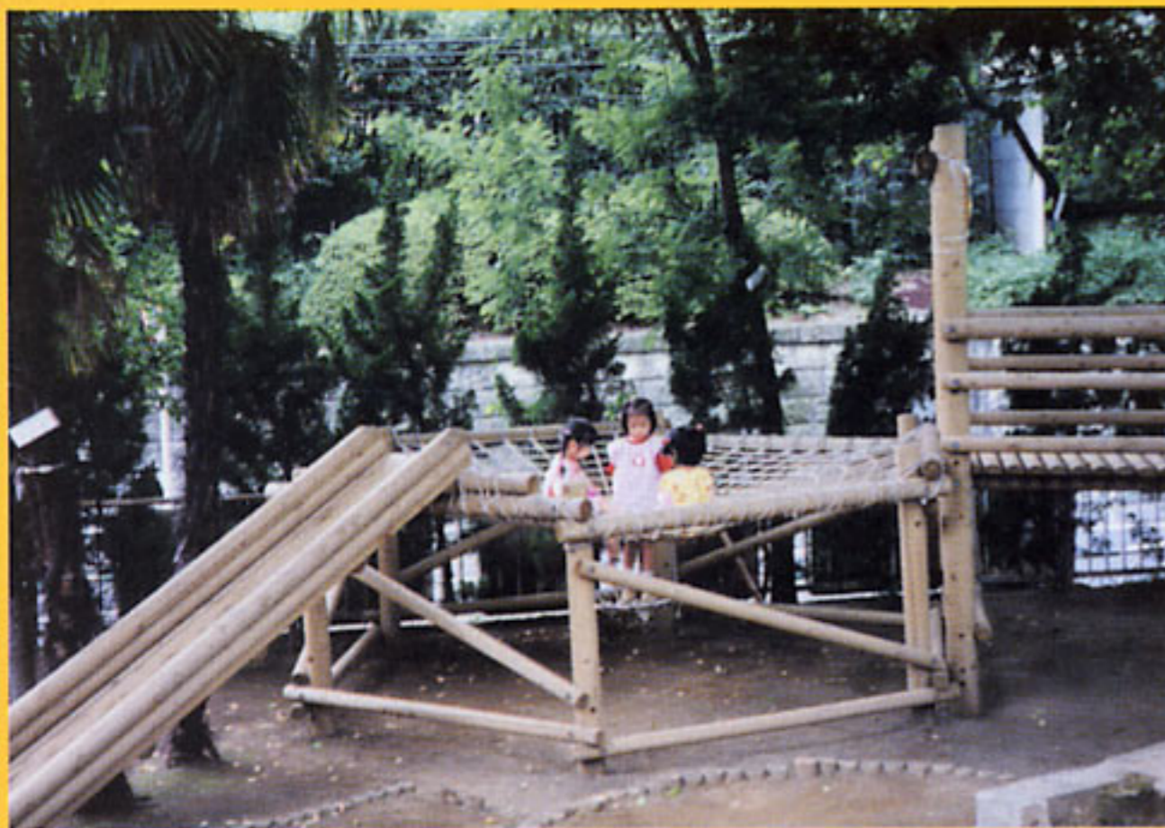
自然の中で、遊びながら様々な活動を体験したり、 挑戦したりできる屋外環境 (東京都:鷺谷さくら幼稚園)