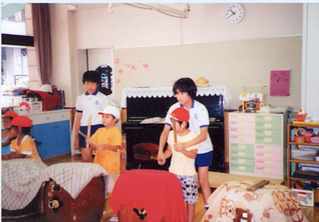
運動会にむけて小学生とのたいこの練習 おねえさんみたいにうまくなりたいな