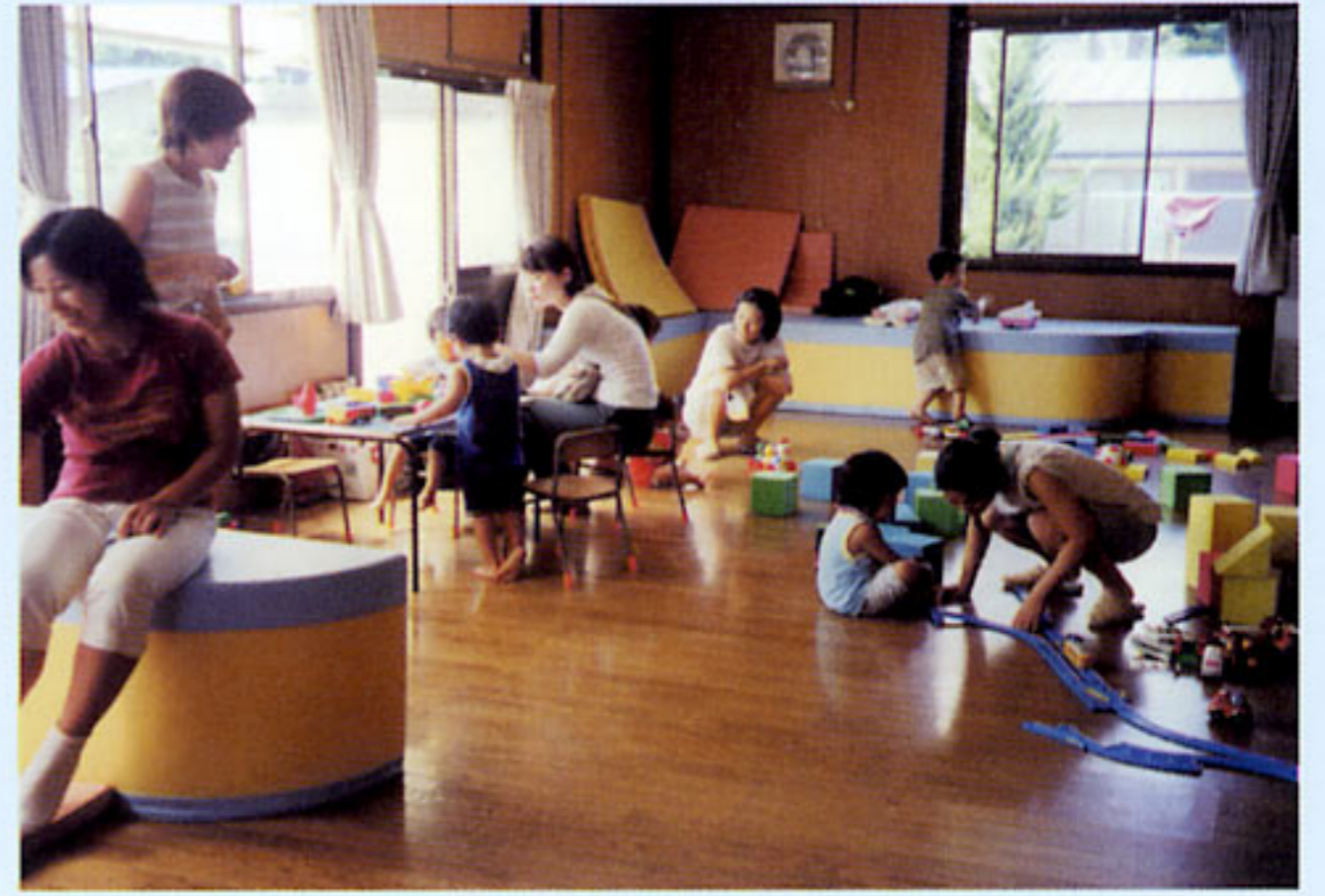
乳幼児を伴う保護者の利用に配慮した子育て支援室 (栃木県:めぐみ幼稚園)