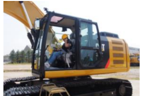
キャタピラー・ジャパン