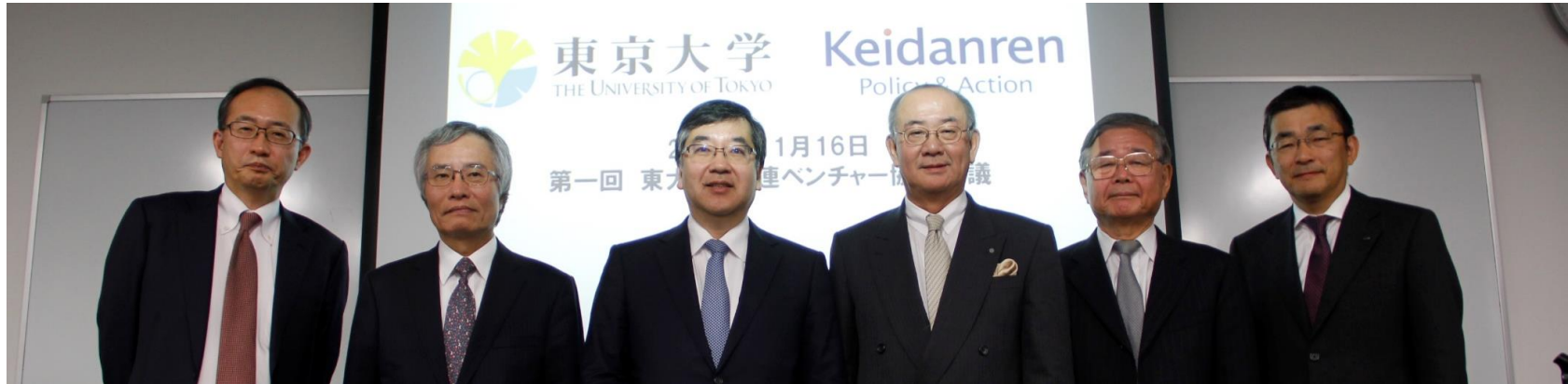
（東大五神総長、経団連根岸企業・中堅企業活性化委員長ほか双方幹部出席）