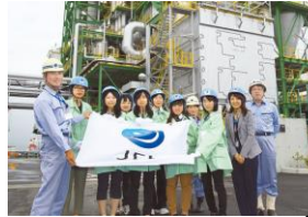
JFEエンジニアリング