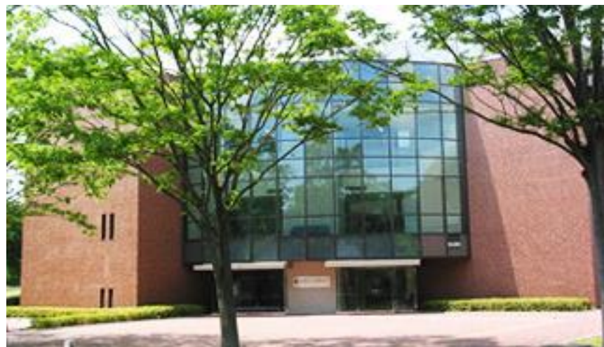
(筑波大学 産学リエゾン共同研究センター棟)