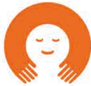
家庭教育支援チーム

全国各地で活動されている家庭教育支援チームのみなさんと参加者のみなさんとの情報交換等を行う交流会を行います。