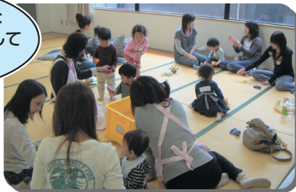
和歌山県橋本市 家庭教育支援チーム(サロン部)の取組