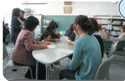
和歌山県橋本市 家庭教育支援チーム(講座部)の取組