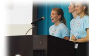
【世界高校生水会議2018年7月】