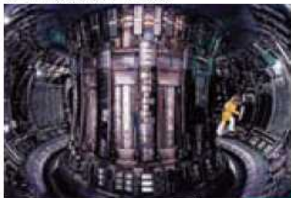
JET カラム研究所(イギリス)