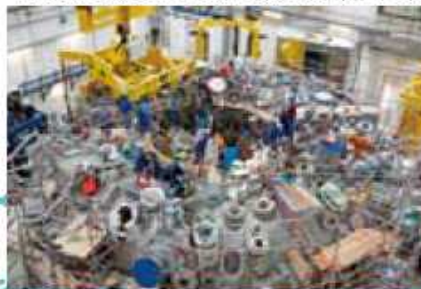
W7-X マックス・プランク・プラズマ物理研究所(ドイツ)