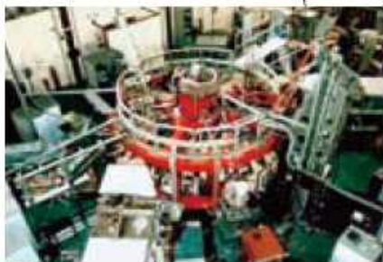
TJ-II エネルギー環境科学技術センター(CIEMAT)(スペイン)