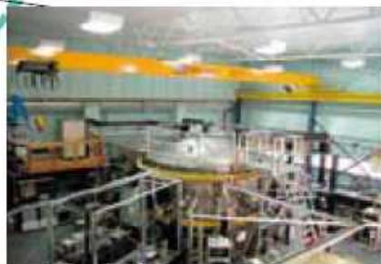
H-1NF Heliac オーストラリア国立大学(オーストラリア)