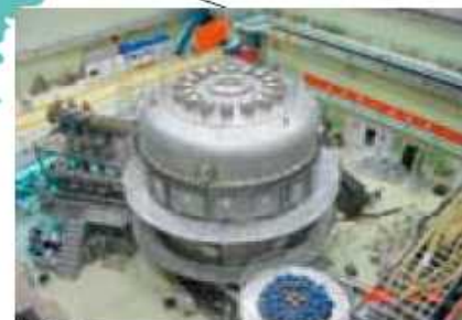
EAST 等離子体物理研究所(中国)