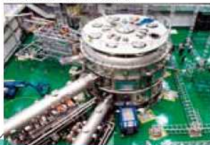
KSTAR 韓国核融合研究所(韓国)