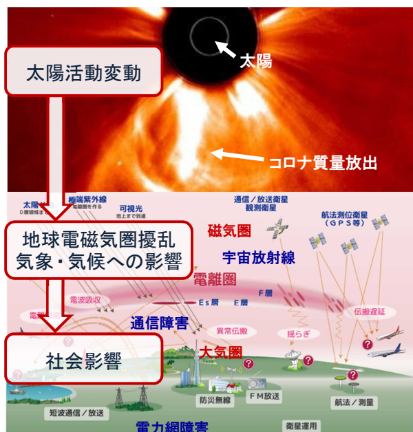
太陽から放出される巨大なコロナ質量放出の衛星観測像とその結果として地球において現れる太陽地球圏環境変動の様々な社会影響

本領域は、我が国が世界に誇る最新の観測システムと先進的な物理モデルの融合によって太陽地球圏環境の変動探る分野横断研究を展開し、科学研究と予測研究の相乗的な発展を推し進めると共に、宇宙天気予報を社会的基盤にまで高めることを目的としています。