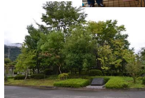
平成の森と東山 魁夷画伯文学碑