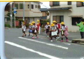
登校時の見守り活動の様子