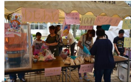
文化祭「流河祭」 での模擬店の様子

地域からは、元教育 長、公民館長、NPO 代表、町内会長、祭 典保存会長、社協、 同窓会長の皆様に 御参加いただいでい る。