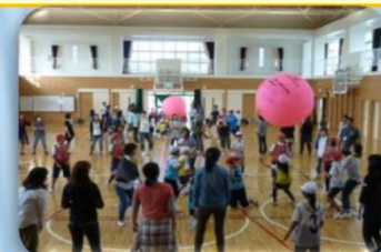
3年生 親子キンボール大会の様子