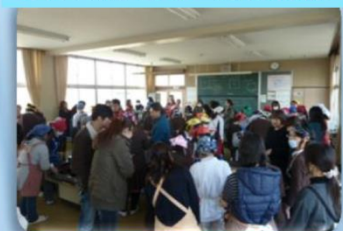
6年生 親子バームクーヘン作りの様子