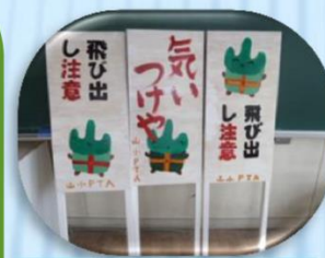
「やまっち」の啓発看板

*親子の絆づくり、保護者同士の親睦を深めるために、各学年ごとにレクレーションを企画し、多彩なプログラムで親子交流会を実施しています。