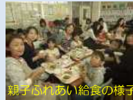
親子ふれあい給食の様子

食育への理解を促進するため、PTAと連携した親子(祖父母)ふれあい給食を開催している。