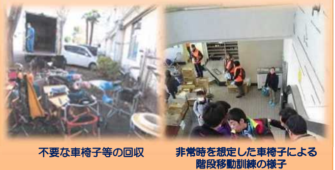
不要な車椅子等の回収