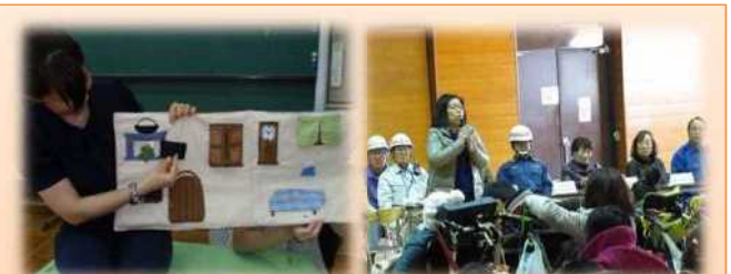
布絵本を使つての読み聞かせ